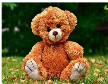
TEDDY BEAR (MIŚ)